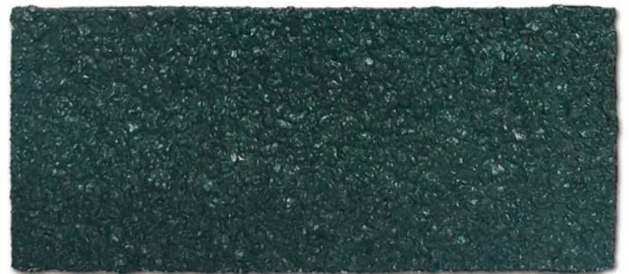
■ 진초록 (NCS 950, SH S 7020-G)