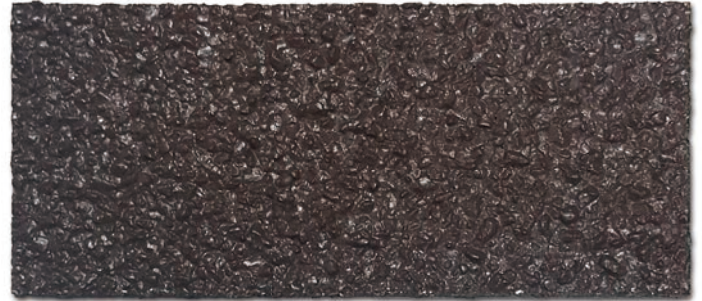
■ 흑갈색 (NCS 950, SH S 8010-Y70R)