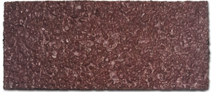
■ 적갈색 (NCS 950, SH S 7020-Y80R)