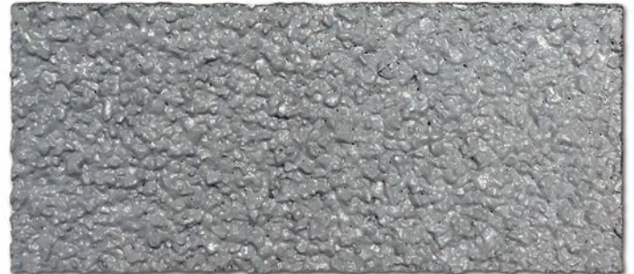
■ 돌회색 (NCS 950, SH S 5000N)